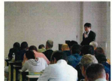
事業説明会及び講習会の様子