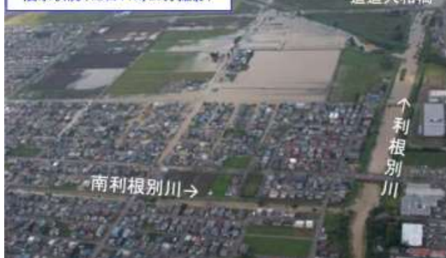
浸水状況（12日11時30分撮影）