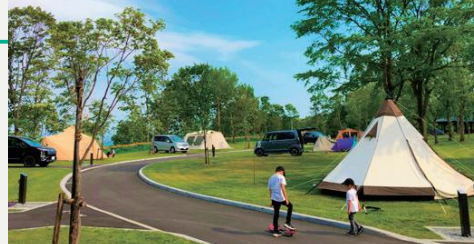
しんとつかわキャンプフィールド場内。