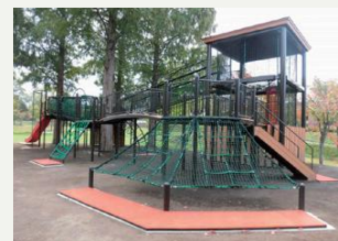
ふるさと公園(大型ネット遊具) 子どもが遊べる大型ネット遊具が隣接しています。