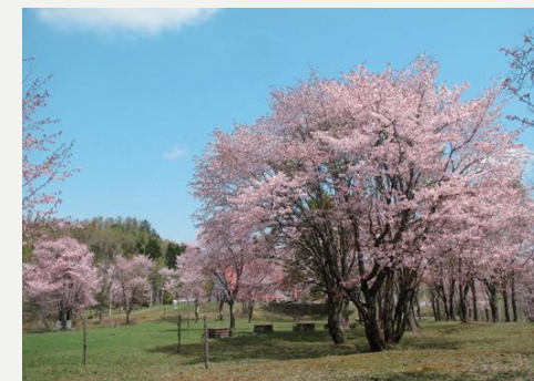
北竜町の桜の名所です。