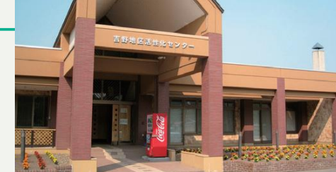
隣接する吉野地区活性化センターで入浴ができます。