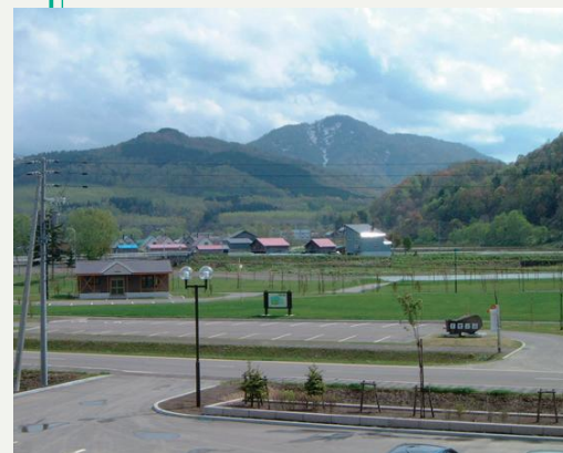
広々としたキャンプサイト。