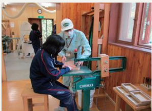
道民の森月形地区 陶芸館工作室