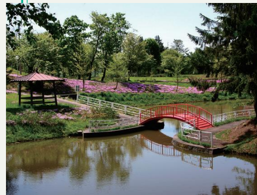
四季折々の風景を楽しめます。