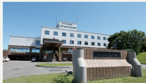
隣接する温泉ホテル「グリーンパークしんとつかわ」。