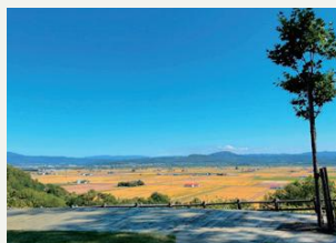
ふるさと公園(当せん地展望台) 奈良県十津川村からの移住の歴史が感じられる展望台が隣接しています。