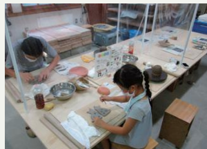
道民の森月形地区 木工芸館工作室