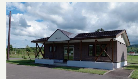
管理棟にトイレや炭捨て場があります。