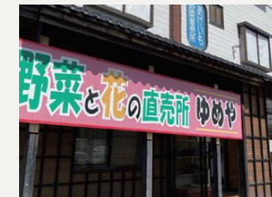
野菜直売所とどけよう倶楽部ゆめや