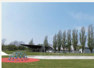
ふるさと公園(噴水・大屋根テラス) 水遊びができる噴水と大屋根テラスが公園内にあります。