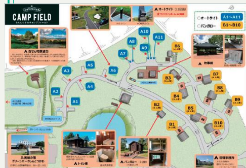
しんとつかわキャンプフィールド場内マップ。