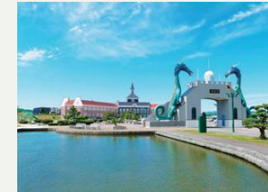
サンフラワーパーク北竜温泉

7月中旬～8月下旬にひまわりまつりを開催。23haの畑に200万本のひまわりが咲きます。