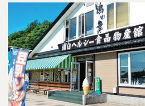
浦臼ヘルシー食品物産館