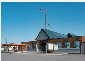
道の駅田園の里うりゅう