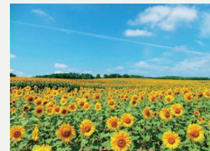
北竜町ひまわりの里

7月中旬～8月下旬にひまわりまつりを開催。23haの畑に200万本のひまわりが咲きます。