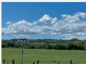
滝川市民ゴルフ場

ラウネ川の上を通るふれあい橋は四季折々の風景が楽しめます。朝の散歩にぴったりです！