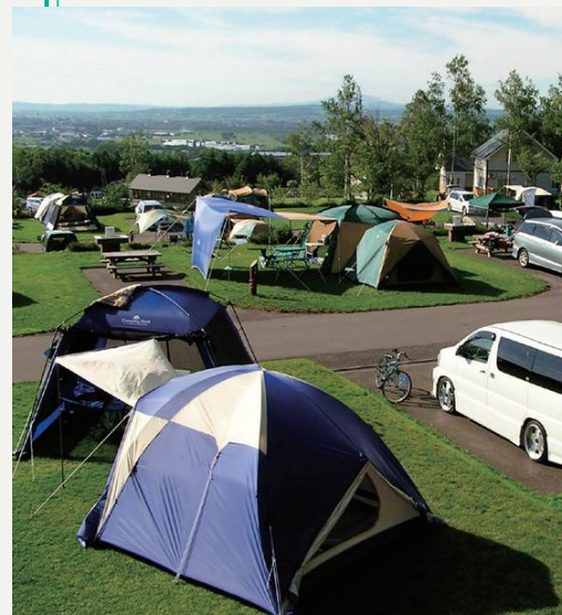
全3種類のカーサイト、2棟のログハウス、6棟のコテージと充実。

小高い丘の上であり絶景が望める本キャンプ場は、多様なサイトやコテージ、全面Wi-Fi等の充実した設備が魅力。