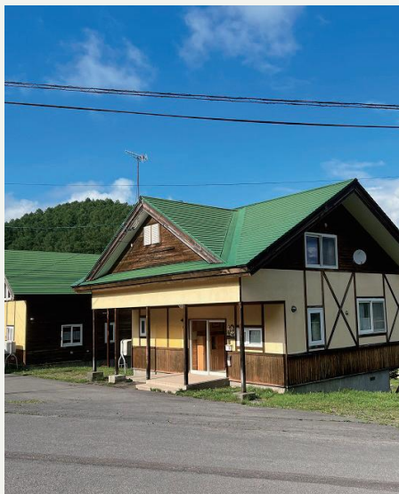
サウナ付きコテージ(6人用、8人用、12人用)。