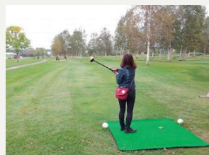
北海道コカ・コーラパークフィールド72