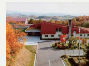
北海道立青少年体験活動支援施設 ネイバル砂川

便利な交通アクセスで、快適な休息、美味しい飲食体験、充実した買い物を楽しめます。