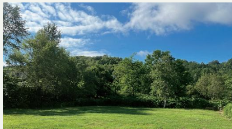
テントサイト(4区画)グループ利用応相談。