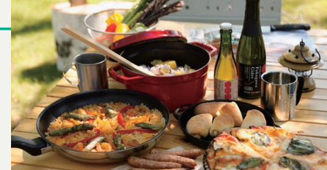
食の宝庫ふかがわ食材で贅沢キャンプ飯。