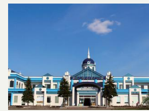
砂川ハイウェイオアシス館

便利な交通アクセスで、快適な休息、美味しい飲食体験、充実した買い物を楽しめます。