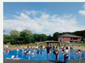
北海道子どもの国