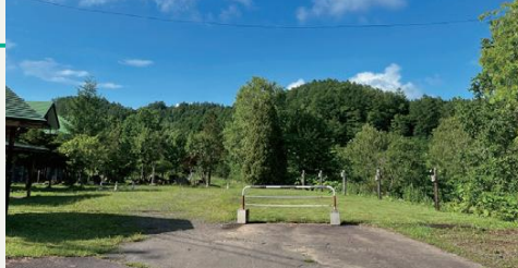
電気付きカーサイト(2区画)。