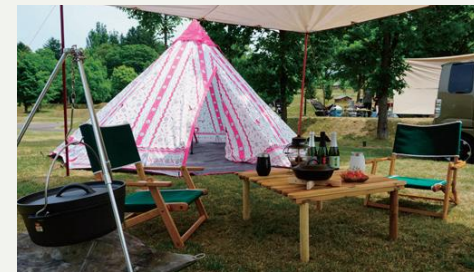
全面Wi-Fi完備で快適なキャンプを。