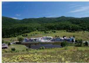
カナディアンワールド

温泉はもちろんバレルサウナや塩サウナも設置!入浴後は雑誌や漫画を見ながらゆったり。