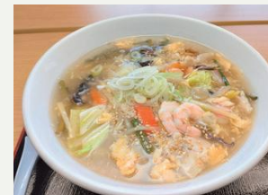
道の駅スタープラザ芦別

市内の情報とお土産品はここで入手。2Fレストランで、名物ガタタンシリーズを堪能。