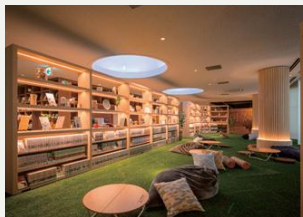
芦別温泉おふろcafé星遊館

温泉はもちろんバレルサウナや塩サウナも設置!入浴後は雑誌や漫画を見ながらゆったり。