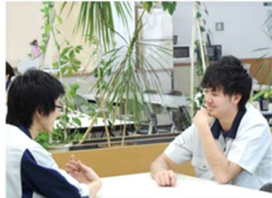
先輩社員(左)と新入社員(右)