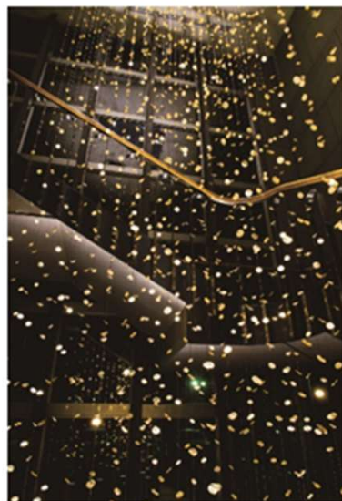
夕張工場 来客玄関

私たち夕張工場は、操業開始以来、シチズン製腕時計の歯車部品を生産する国内拠点として「世界一優良なる時計製造工場の実現！」をスローガンに技術力世界一を目指し事業を進めて参りました。