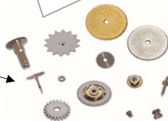
夕張工場の歯車部品