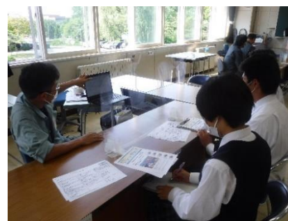
空知管内林業就職説明会 (岩見沢農業高等学校)