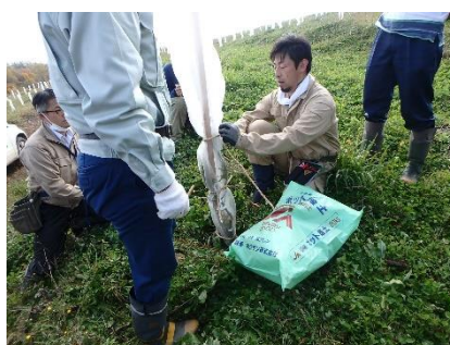
クリーンラーチの育成保護 (採種園)