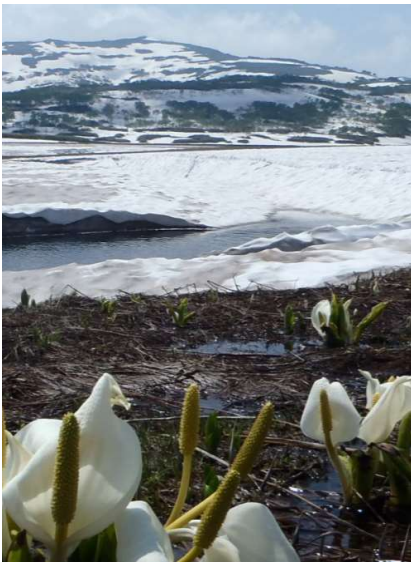
残雪の雨竜沼湿原（雨竜町）

このほかにも、管内には自然豊かな森林、湖沼などが広がっており、これらの場所では、自然とふれあいながら環境への理解を深めることができるよう、遊歩道やキャンプ場等の整備が行われています。