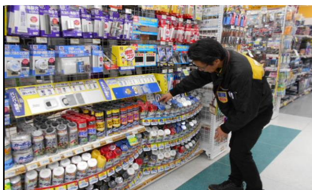
販売（商品陳列作業）

私は自動車の関係は全く興味がなかったんです。ですが仕事をしていくうちに次第に達成感とやりがいを感じるようになり、今ではいろんな仕事を任せられるようになりました。お客様からの質問に答えられ「ありがとう」と言ってもらえるのが何よりうれしいです。今後はさらにステップアップして店内の商品を全て把握して、また車検受付等どんどん仕事をこなせるようにしたいです。