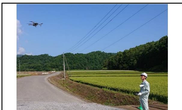
ドローンによる写真撮影の様子