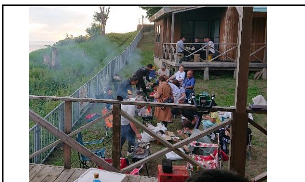
令和3年度 親睦会キャンプの様子