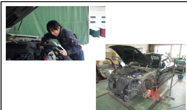
自動車整備/钣金塗装修理