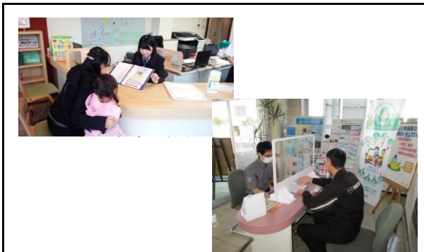
フロント営業/お客様対応