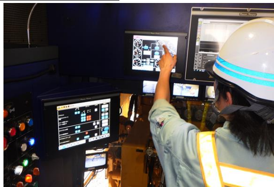
【マルチプルタイタンパーを操作】