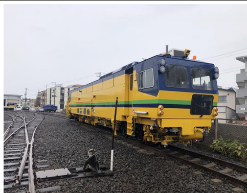
【線路の歪みを補正するマルチプルタイタンパー】