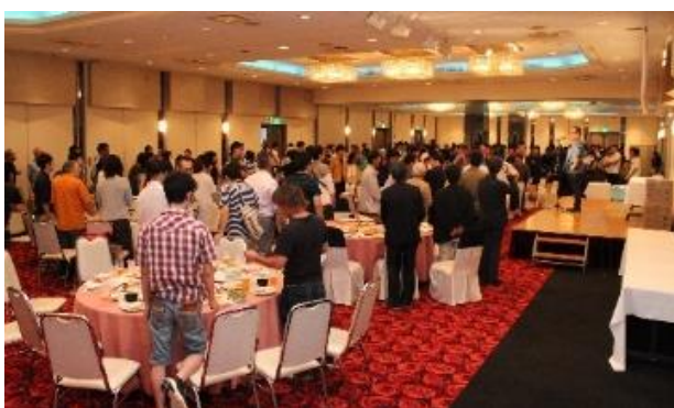
【社内懇親会の様子（2018年）】