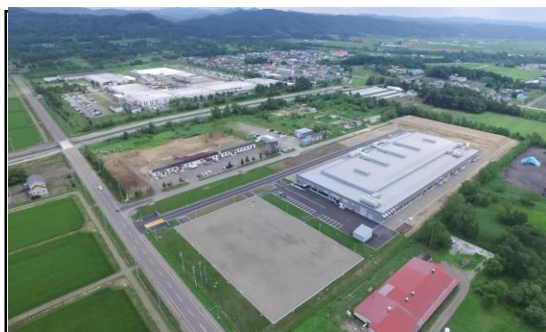
【2021年新建屋 航空写真】