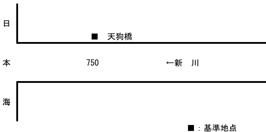
計画高水流量配分図 (単位：m 3 /s)