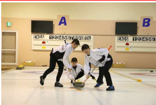
▲カーリングをする選手たち

人気急上昇中のカーリングを妹背牛町で体験！小学生から高齢者まで多くの方に親しまれています。あなたも一度妹背牛町で体験してみませんか？