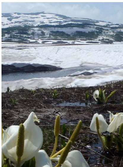
残雪の雨竜沼湿原（雨竜町）

このほかにも、管内には自然豊かな森林、湖沼などが広がっており、これらの場所では、自然とふれあいながら環境への理解を深めることができるよう、遊歩道やキャンプ場等の整備が行われています。