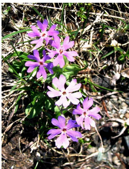
ユウパリコザクラ（夕張市）