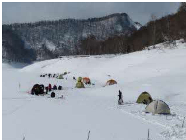
桂沢湖のワカサギ釣り(三笠市)

また、千歳川では、「サケ」資源増大のため、民間増殖事業団体によるふ化放流が行われているほか、幾春別川等でも市民団体等による放流が行われています。