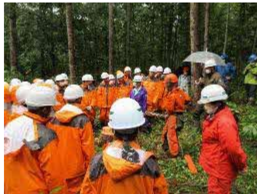
岩見沢農業高校の生徒を対象に実施した林業体験学習(芦別市)

管内の内水面では、石狩川が縦走り、旧河川跡などの沼が多く、「ワカサギ」「ドジョウ」「ヤツメウナギ」などの淡水魚類の生息適地となっています。