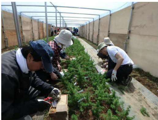
クリーンラーチの花粉木用苗木の接ぎ木作業(深川市)

★単位未満を四捨五入しているため、総数と内訳の集計値が一致しない場合があります。