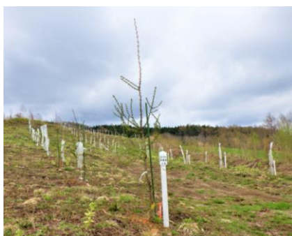
クリーンラーチの生育状況 (採種園)