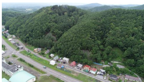
上砂川町鶴地区の山地保全 (治山事業)

★単位未満を四捨五入しているため、総数と内訳の集計値が一致しない場合があります。