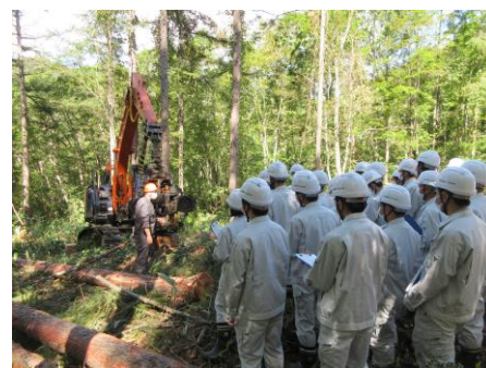
林業技術現場体験学習 (岩見沢農業高等学校)