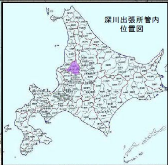
深川出張所管内 位置図