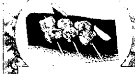
ベコロスの肉巻き串