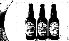
空知ブランドのクラフトビール (ワイツェン/エール/ピルスナー)