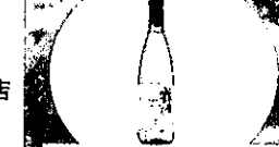
鶴沼ワイン ピノ・ブラン