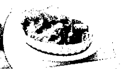
空知野菜のグリル ラクレット