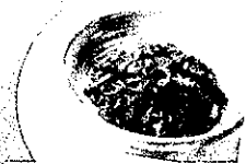
沼田産熟トマトケチャップで仕上げた蕎麦ナポリタン