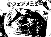
「神内和牛あか」クオーターパウンドステーキ

【北海道はっかい道】 西船橋店 【オホーツクの恵み】 市ヶ谷店・西新橋店 【大地の恵み北海道】 永田町店 新宿東宝ビル店 【北海道バル海】 東京駅グランルーフ店