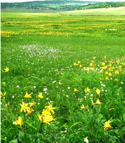
夏の雨竜沼湿原（雨竜町）

これらの場所では、自然に親しみながら理解を深めることができるように、遊歩道やキャンプ場などの施設整備も行われています。