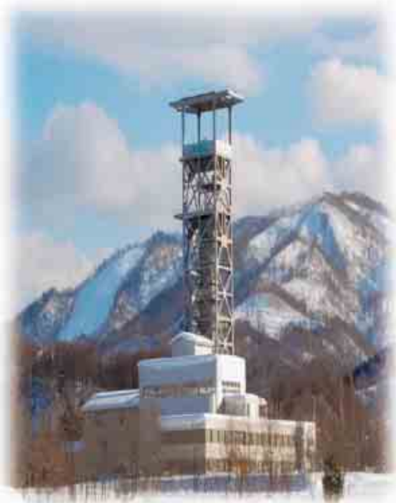
上砂川町 旧三井砂川炭鉱中央立て坑やぐら