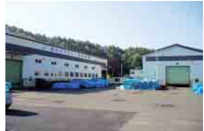
コンクリート型枠の製造、販売 建設用金属製品製造