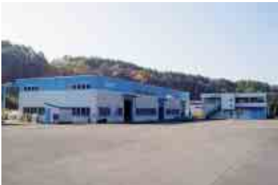
FRP製浄化槽の製造、販売、施工