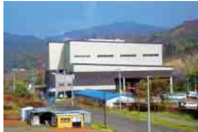
可燃性一般廃棄物を燃焼して得られたエネルギーで発電と熱供給