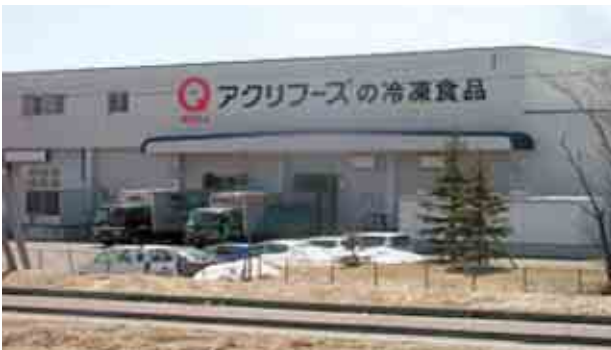
北海道産の農産物原料にこだわった冷凍食品