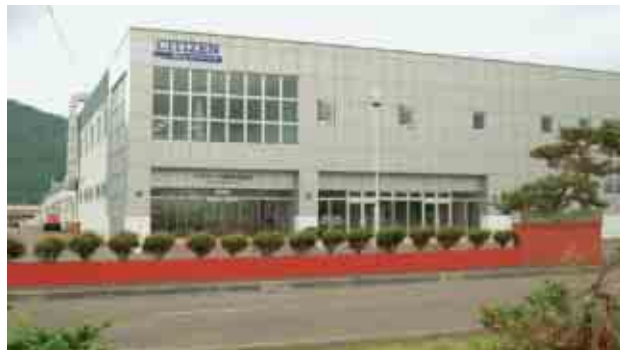
シチズン製腕時計の部品製造の拠点