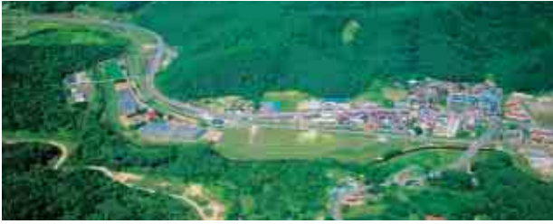
●工業団地の区画図