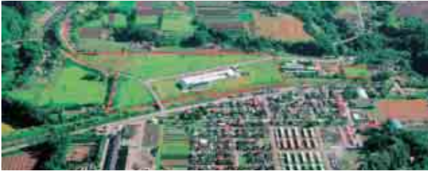
●工業団地の区画割り