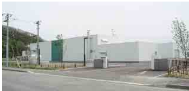
遺伝子の欠損したモデル動物等を使用した 創薬・診断薬の研究開発