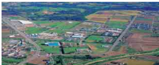
●工業団地の区画割り