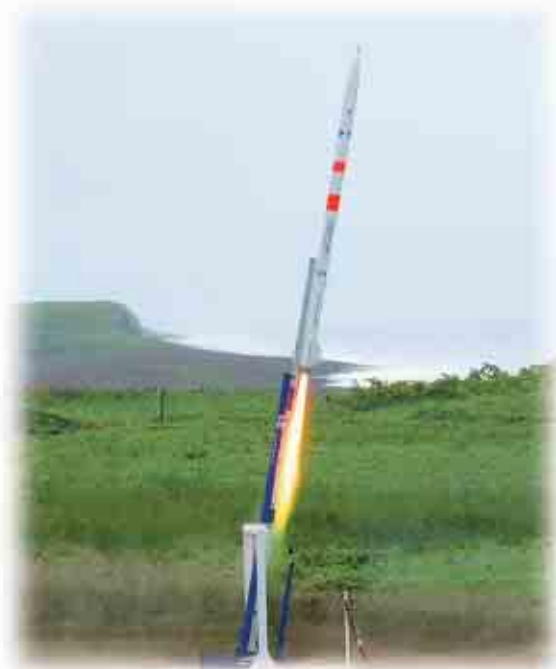
(株) 植松電機・HASTICのロケット打ち上げ