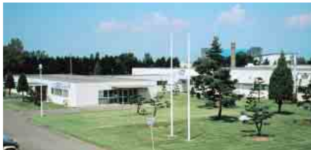
高品質の高耐圧ダイオード、サージ吸収素子を一貫生産し、民生、産機、自動車、医療分野に事業展開