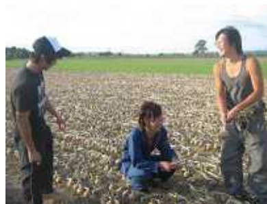
玉ねぎプロジェクト

その他に、地元のお祭り等にお店を出店したり、 最近では天使大学との合同の企画も考えてます。 特に地域・地元との連携を大事にしています。