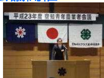
アグリメッセージ発表

午後からは、プロジェクト発表が行われ、3部門に6名の参加があり、各4Hクラブが1年間掛けて成し遂げたプロジェクトについて発表し、発表者のみならず、参加者それぞれが今後の農業について考えることのできた、大変有意義なひと時になったと思います。