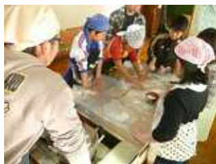
小学校でのうどん作り

また、今年は3年目の玉ねぎプロジェクトが全道大会まで進みました。 惜しくも入賞は出来ませんでした。併催で全国交換大会も兼ねた大会でしたので、全国の農業青年にも栗山4Hのことを知って貰えたのではと思っています。