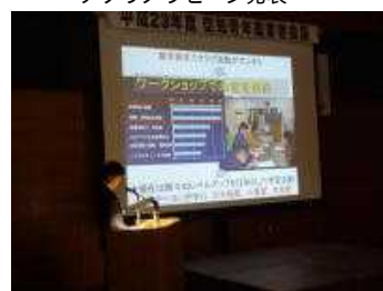
プロジェクト発表