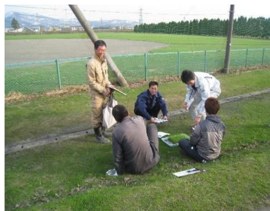
太陽の下での観察も重要です