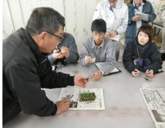
「2.2葉ですよ」「数えました!」