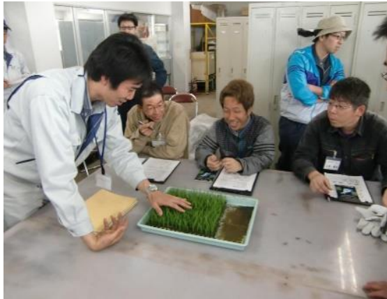
「苗は初めて?」「初めてです。」

最後に普及センターの職員により「水稻育苗管理の基礎」の実習が行われました。塾生は3班に分かれ、2.2葉位に生育した成苗ポットの実物を使い、各葉の名称や葉数の数え方、苗の管理等を習得しました。