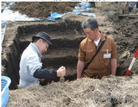
「耕盤層を調べます」