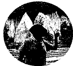
ガイド 伴野卓磨氏 (Discover EZO代表)

北海道の食の魅力と歴史の面白さを伝える“グルメ系”まち歩き研究家 同氏主催のガイドツアーは毎回満員御礼。参加費4,000円~8,000円で人が殺到するガイドツアーとは何なのか？人気の秘密を体験してみませんか？